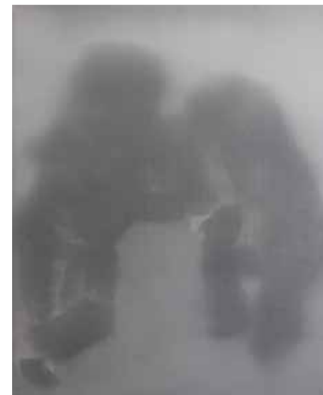
Supremacy (Grey), 2018, olio su tela, 30x24cm

Si diploma in pittura nel 2007 e in progettazione e cura degli allestimenti nel 2010 all'Accademia di belle arti di Firenze. Nel 2014 è selezionato per la 1ª edizione del Premio FAM Giovani per le arti visive (AG). Nel 2015 è selezionato da Eva Comuzzi ed Andrea Bruciati per Some Velvet Drawings (ArtVerona). Tra il 2015 e il 2017 è finalista in numerosi premi tra cui il Premio Fondazione San Fedele (Milano), Premio Combat Prize (Livorno), Premio Arteam Cup (Alessandria) e Premio Francesco Fabbri (Treviso). Nel 2015 è vincitore del Premio Marina di Ravenna e nel 2016 del Premio We Art International (Milano). Nel 2015 è artista selezionato dai curatori del premio ORA. Nel 2016 è uno dei finalisti di TU 35, geografie dell'arte emergente in Toscana, promosso dal Centro per l'arte contemporanea Luigi Pecci di Prato. È presente nella collezione Identità Siciliane di Imago Mundi, Fondazione Benetton. Nel 2017 partecipa a Modernolatria Boccioni+100 esponendo alla Galleria Nazionale di Cosenza. Nel 2017 è finalista al 18° Premio Cairo (Palazzo Reale Milano). Menzionato dalla rivista Arte (Cairo Editore) come uno degli artisti under 40 significativi dello stato della ricerca artistica italiana.