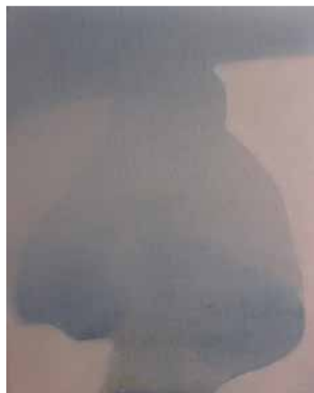
Gorilla (rose light) , 2016, olio su tela, 30x24 cm

Non si tratta tanto di sviscerare le ragioni che hanno portato alla situazione di conflittualità (compito che deve essere lasciato alle discipline storiche, politiche, di psicologia collettiva o all'analisi del giornalismo di cronaca) quanto a operare un focus sulla percezione animale, e quindi anche umana, dello spazio, nel suo lavoro di continua colorazione della realtà attraverso cui le stesse cose possono apparire sempre diverse. Possibile che questo terreno nel quale un attimo fa mi sentivo a casa sia ora un luogo pericoloso?