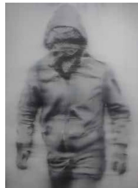
About reactions (urban warrior) Ver. 3 , 2019, olio su tela, 70x50cm

Il giorno dopo un gentile rivenditore ci spiega che un semplice vecchio, forse un po' pazzo, ha esplosa qualche colpo di pistola in aria, senza nient'altro di importante da segnalare.