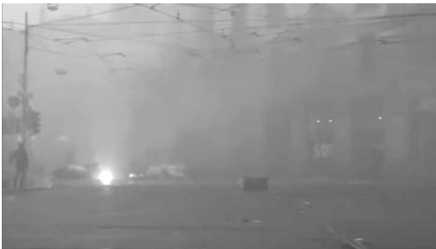
Guerriglia Milano, 2018, still da video